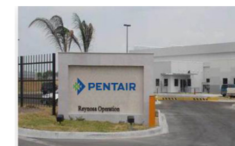
Pentair Reynosa, Mexiko