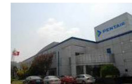
Pentair Suzhou, China