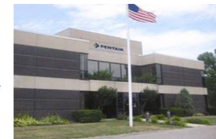
Pentair Dover, USA

Unsere Filtrationssysteme und Bauteile werden an 4 verschiedenen Standorten hergestellt, von denen jeder sein Spezialgebiet hat. Pentair in Dover widmet sich unseren bekannten Fibredyne-Kartuschen. Das Werk in Suzhou ist das Kompetenzzentrum für Meltdown und UO-Kartuschen und Anlagen sowie für UV-Filtrationssysteme. Pentair Reynosa in Mexiko konzentriert sich hauptsächlich auf Gehäuse. Pentair Suzhou und Reynosa sind nach ISO 9001:2008 zertifiziert.