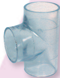
PVC T-Stück 90°