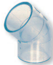
PVC Winkel 45°