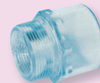
PVC Übergangsmuffennippel Außengewinde