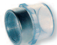
PVC Übergangsmuffennippel Innengewinde