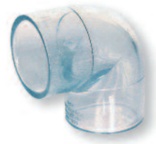
PVC Winkel 90°