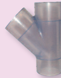
PVC T-Stück 45°