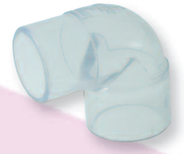
PVC Winkel 90°, eine Seite Klebemuffe, andere Seite Klebestutzen