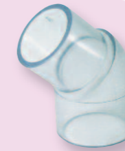
PVC Winkel 45°, eine Seite Klebemuffe, andere Seite Klebestutzen